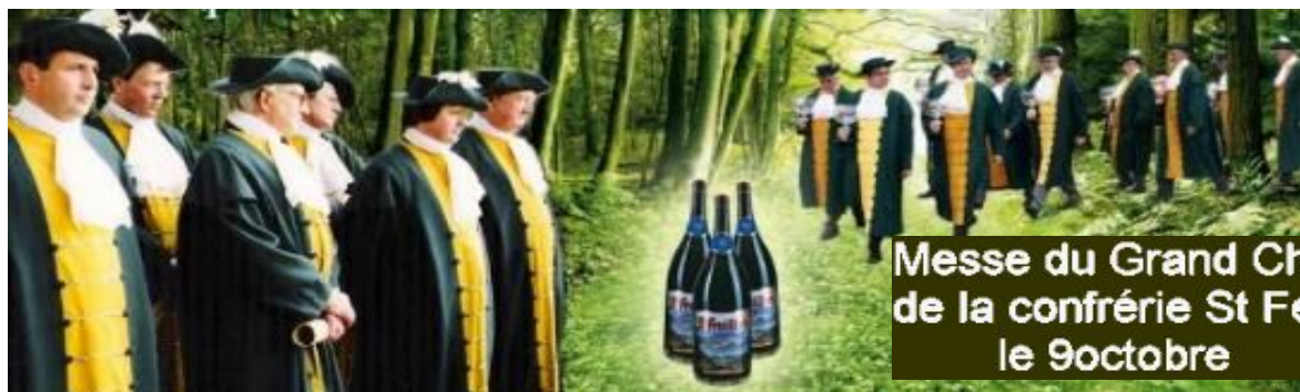
Messe du Grand Chapitre de la confrérie St Feuillien le 9 octobre